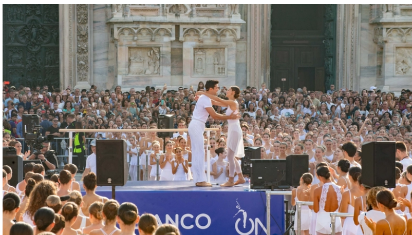
Roberto Bolle e Nicoletta Manni danzano in piazza Duomo a Milano

Una lezione di danza unica nel suo genere, trasmessa in diretta su Rai Uno: "A piccoli passi si può raggiungere il proprio obiettivo"